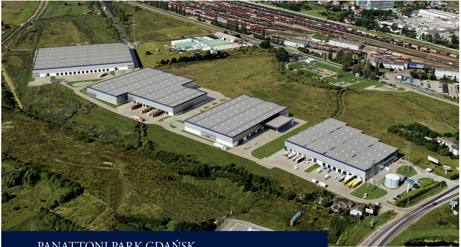
PANATTONI PARK GDAŃSK