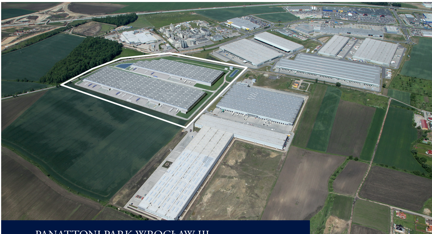
PANATTONI PARK WROCŁAW III